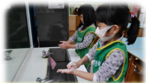
防疫宣導-洗手步驟、方式