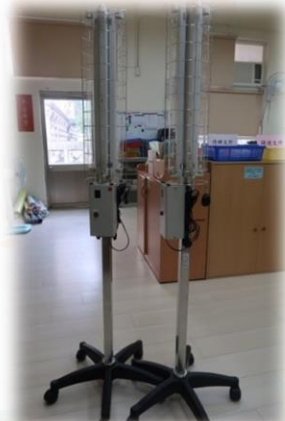
紫外線殺菌燈固定消毒