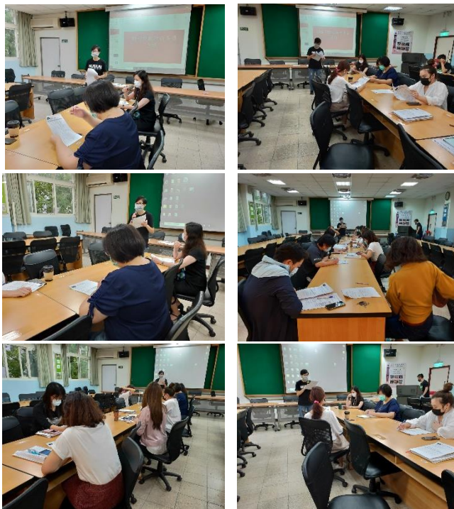
「特教推行委員會組織與運作」組織架構圖