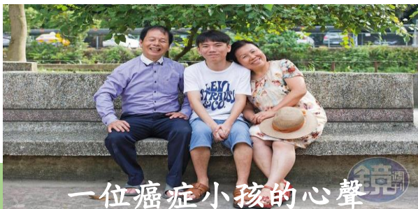
一位癌症小孩的心聲

https://zh.wikipedia.org/wiki/%E5%91%A8%E5%A4%A7%E8%A7%80