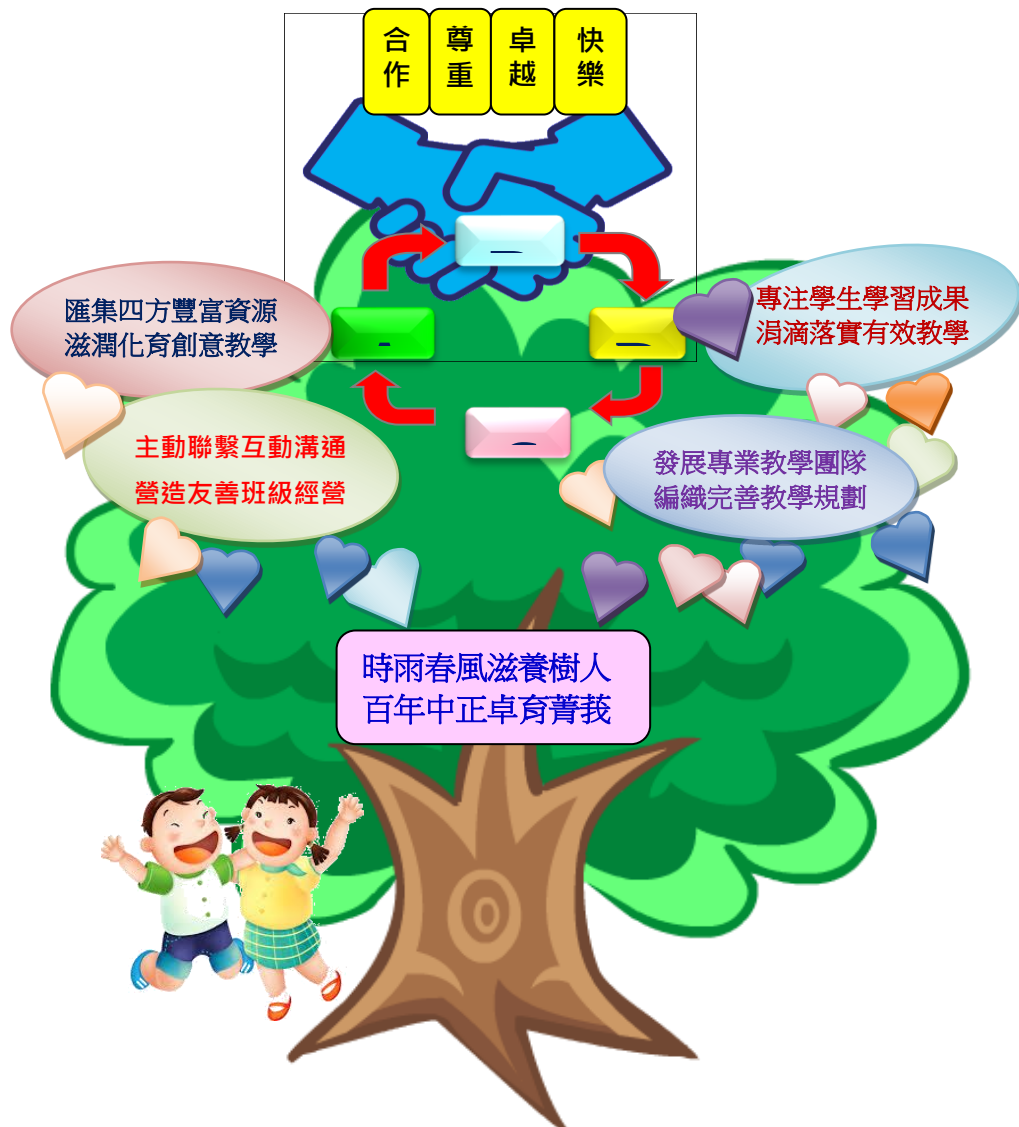
具體目標說明意象圖