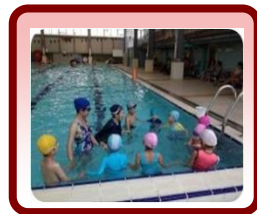
中高年級每 周 1 節游泳