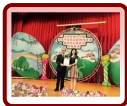
行動研究獲得 團體第 5 名

為推動校內閱讀教育，讀報教育 103~106 年累計參與班級數已達 64 班；「詩香滿校園」活動利用兒童朝會進行，自 104 年度起累計達約 2400 人次。規劃一生一專長之認證，包含游泳、籃球、視覺、聽覺藝術等、於藝術與人文及健康與體育課程實施。校內規畫多元體育活動，希望培養終身運動習慣，推動班級晨跑活動、舉辦班際體育競技、運動學習護照認證和多样體育類課後社團，104 學年度起並加強辦理健康促進計畫與學生運動 SH150 計畫，以運動儲蓄的觀念，建立喜愛運動習慣，培育終身運動觀念，重視學童運動及健康。中、高年級每周進行游泳教學，使學生習慣、熱愛游泳，近 4 年畢業生游泳通過率，平均高達 94.5%。各領域融入「中正十美」特色課程，使學生透過生活經驗，豐富學習成效；106 學年度資訊融入教學達 96%，透過豐富學習載具與網站規劃，增加學習興趣及也提升學生自主學習之可能。