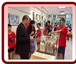
美展由學生解 說創作歷程