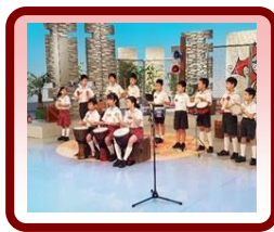
聽障打擊樂團 公共電視特輯