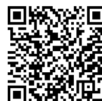
報名表單 QR Code